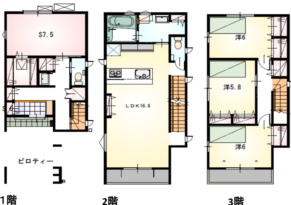
1階 2階 3階