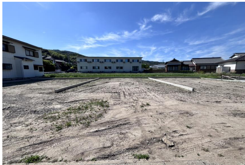
現地写真 (2026年5月撮影)