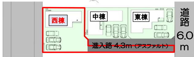
≪3棟配置図≫ 3台以上駐車可能！