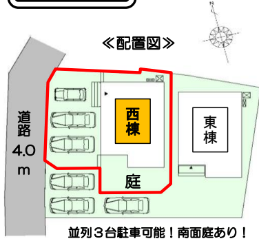
並列3台駐車可能! 南面庭あり!

大家族でもゆとりのある5LDKの間取り♪ 家族とコミュニケーションがとりやすい対面式のキッチン♪ 全居室収納付き! 2.3帖のウォークインクローゼットなど各所収納が豊富♪ お掃除がしやすい充実の水回り設備!