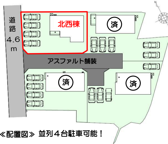
◀配置図▶ 並列4台駐車可能！

駅・スーパー車で10分圏内！152号線まで車で3分！ のどかで落ち着いた住環境♪