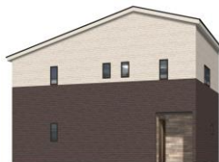
完成イメージ(東側)

スーパーまで徒歩4分、磐田駅まで車で8分! 生活便利な立地♪ 小学校まで徒歩6分、中学校まで徒歩12分! 通学安心♪