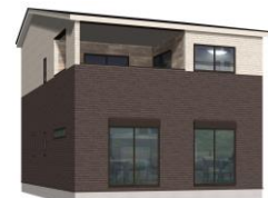
完成イメージ(南側)