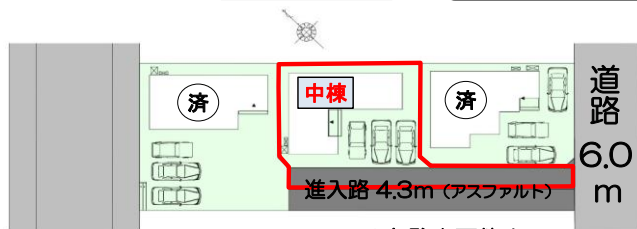
《3棟配置図》 3台駐車可能!