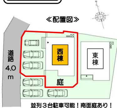
並列3台駐車可能！南面庭あり！