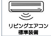
リビングエアコン 標準装備